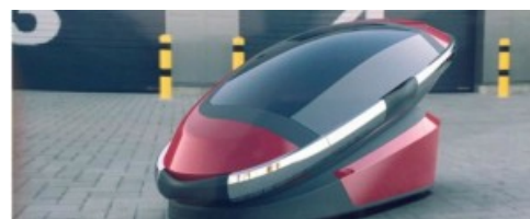
THE SARCO: UNA CÀPSULA DE SUÏCIDI IMPRIMIBLE EN 3D