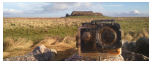
UNA CÀMERA PERDUDA EN LA PLATJA GRAVA EL SEU VIATGE DE 800 QUILOMETRES PEL MAR